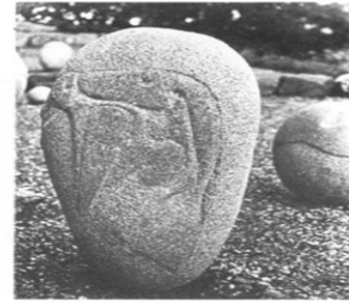
Resim 1: Taş Sıraları / Carnac – Brittany (Jaffe, ty.: 233)