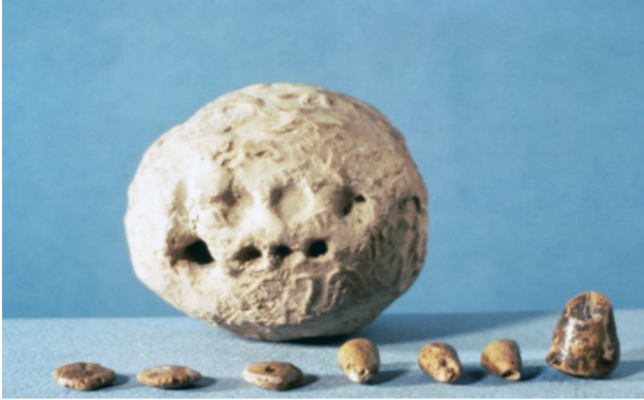
Resim 6: Kil Semboller (Swetz, 2012)

Resim 6 'da hesaptaşının bir yansımasını bulmak mümkündür. Bu sistemde kil semboller belli bir mala karşılık gelmekte ve bu kapsamda büyük koniler büyük tahıl miktarını, küçük koniler daha az tahıl miktarını temsil etmektedir.