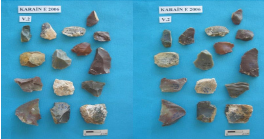
Resim 2: Tayasiyen Yongalar / (Sağ: Üst yüz; Sol: Alt yüz) Karain Mağarası – (Foto: Metin Kartal) (Yalçınkaya, 2009)

Bu kapsamda Anadolu topraklarının da iletişim tarihi açısından son derece önemli olduğu yorumunda bulunmak mümkündür. Resim 2 'de yer alan görselde de Karain Mağarası'nda bulunan yongalar yer almaktadır.