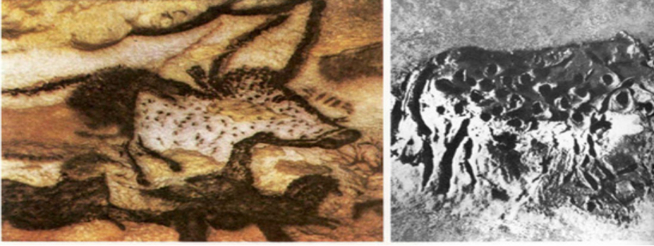
Resim 3: Mağara Duvarı Çizimleri (Jaffe, ty.: 234)

Aşağıda yer alan görselde de geçmişi çizimlerin ipuçlarından yola çıkarak anlama ya da yorumlama şansı sunan mağara resimleri yer almaktadır.