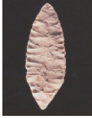
Resim 5: Solütreen Defne Yaprığı Biçimli Uç / Pech de la Boissière - Fransa (Bosinski, 1990: 133'den akt. Yalçınkaya, 2009)

lendirilmiştir. Resim 5 'te yer alan görselde şekillendirilmeye örnek oluşturacak bir nesne yer almaktadır.